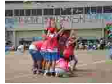
高学年は9人10脚に増える増殖リレー