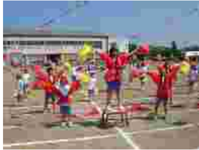
恒例の応援合戦。新しく工夫された演出もありました。「かわいい！」の声も。