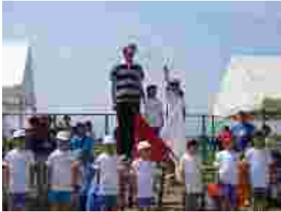
1年生と地域代表の方の選手宣誓。元気いっぱい！

またとない晴天のもと、中川小学校としての最後の大運動会が行われました。閉校を意識して各種工夫が盛りだくさん。子ども達も、応援する地域の皆様も、思い出を共有できるイベントとなりました。写真から、雰囲気を感じていただけでしょうか