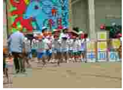
中川の伝統が文字として現れる児童会種目。