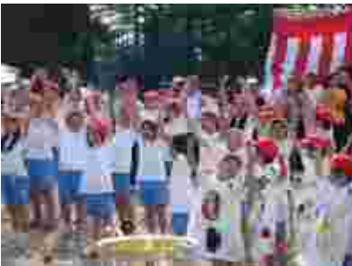
今年は競技も応援も紅組の優勝。審査は厳正です。そして閉校記念の餅まき。大喜びの子ども達。