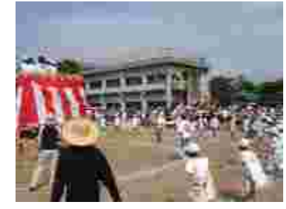
フィナーレは中小盆踊り。檣の上で生演奏。