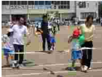
低学年はお家の人と二人三脚。