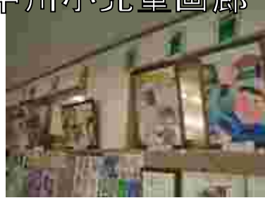
児童の作品を教務室前廊下に飾っています。児童画廊、ご覧ください。