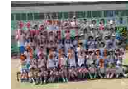
最後にみんなで記念写真。