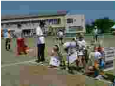
中学年はメッセージを叫んでパン食い競争。