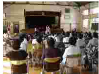
地域の方もいっぱい。また思い出が作れました