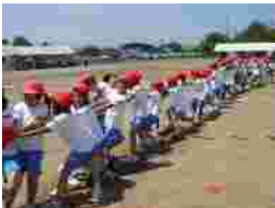
「閉校！」「統合！」と叫ぶ時間差綱引き。