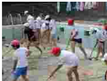
草1本も残さず取りました。プール床をこするのにも真剣です。