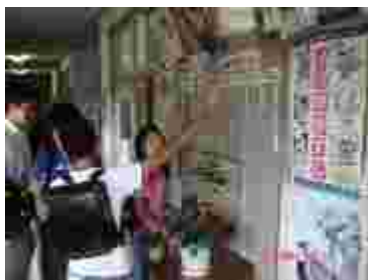
パスカードを進級させる6年生

その「運動」に関して、本年度は進んで運動するカードを「体力向上パスカード」として取り組んでいます。外遊びに限らず、屋内でも進んで運動すれば進級できるようにしたものです。「一輪車」「メンコ（投げる運動）」「バスケットシュート」などが種目として追加されました。しかし人気があるのが「竹馬」や「フラフープ」のようです。種目は、学級で話し合っ追加することもできます。現在6段を超え、2枚目に入った子が14名います。お子さんは現在何級でしょう。ご来校のうちに、ご覧ください。