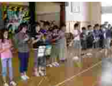
6年生は全員でリコーダー発表。うっとりする音色。