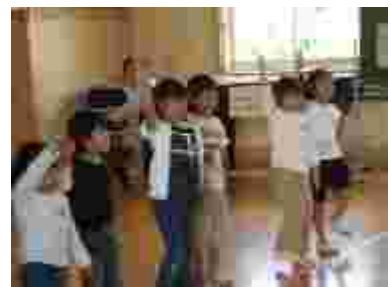
1年歌発表。動きも付けて、かわいい！！