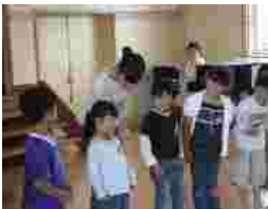
発表後に、司会者からインタビュー。