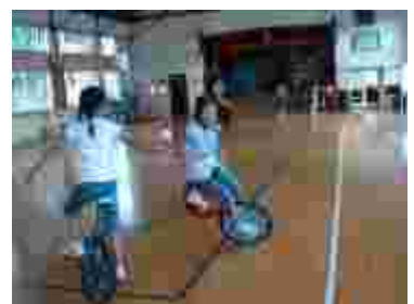
一輪車と組み合わせる名人も！