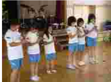
3年リコーダー発表 習ったばかりなのに、すごい！