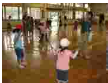
人気のフラフープ。2年生もスイスイ。