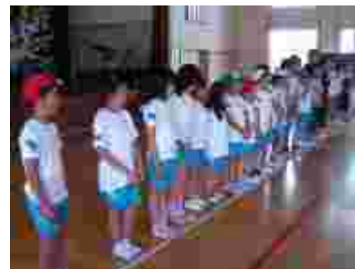
聞いていた子ども、感想発表。これも表現力です。