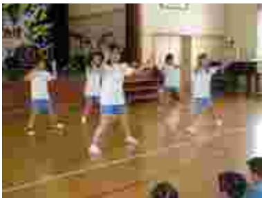
4年ダンスチーム。そろった動き、カッコイイ！

本年度第1回目の「見て見て聞いて聞いてコーナー」が行われました。今年も、芸達者ぞろい。授業とはひと味ちがう表現力が発揮されました。次回は7月13日。中川サロンにいらっしゃるなら、この日がお薦めです。子どものパフォーマンスをご覧ください。