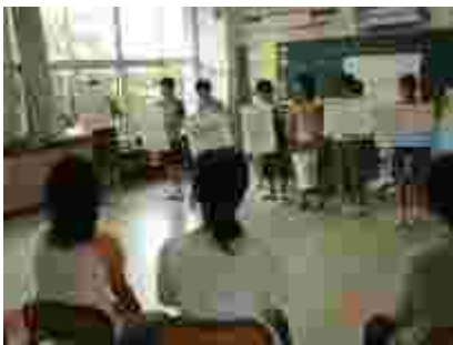
5年生は稲栽培の発表、参観者にクイズも

救急法講習会では、2体のダミーを使って、じっくり実技を学びました。救急法も、年々変化していることが分かりました。また、2学期から学校にも配備される AED(助細動機)の使い方も教えていただきました。