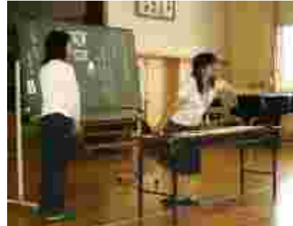
身を乗り出して熱が入ります