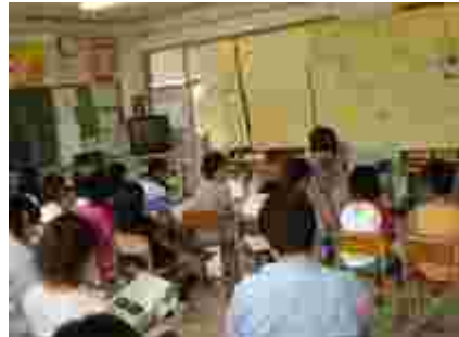
4年生は加治川をの環境をポスターセッションで