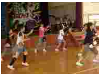
定番!ダンス。新メンバーを加えて。