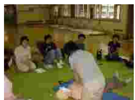
心臓マッサージは30回、疲れる！