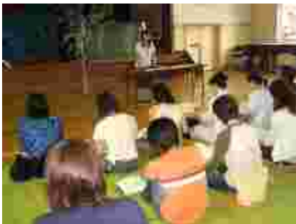
食育講話。資料を見ながら我が家庭を振り返る