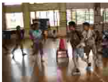
5年生の劇「ちょい悪桃太郎」