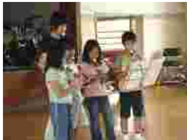
リコーダーでしゅとりと。