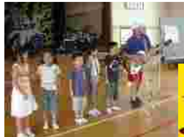
2年生と睦先生の「ごはんがおいしい歌」