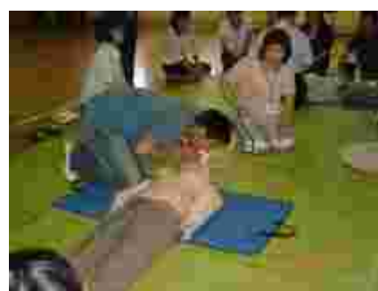
お父さんの肺活量はすごいです