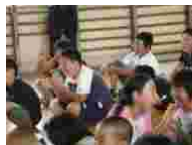
見ている子達に大受け、笑いの渦!