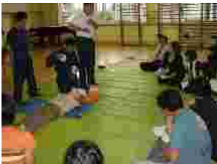
救急法講習会 AEDの使い方指導