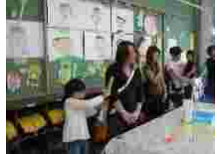
1年生は音読発表の感想を参観者にインタビュー