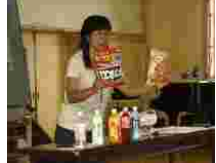
実物を見せられると、実感がわきます