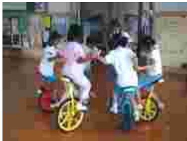
2・3・4年生、一輪車のウルトラC技。

中川小名物「見て見て聞いて聞いてコーナー」2回目が7月13日に行われました。ますます発表内容が増え、子ども達の表現力に驚かされました。