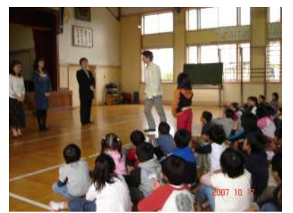
質問コーナーもありました。