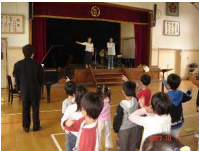
指揮の指導もありました。1年生もがんばります。