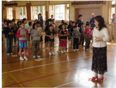
横隔膜を動かす発声指導。