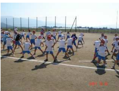
青空の下、準備運動。