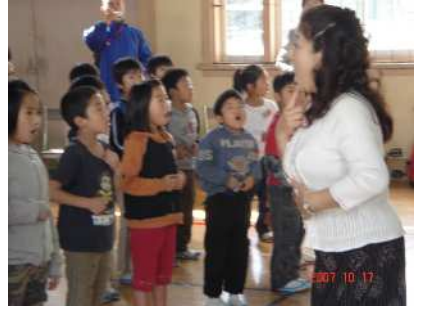
児童の口が大きく開き、みるみる歌声が変わってきます。