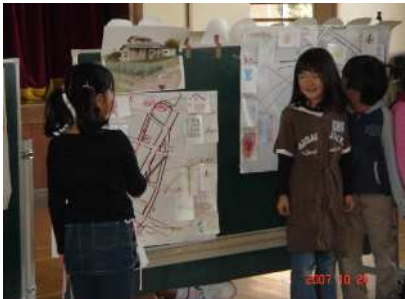
原稿を見ずに暗記して発表しました。ええと、ボクの番は...。地図も手作り。