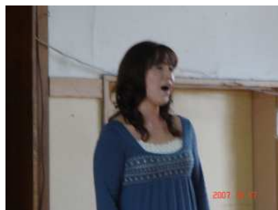
その後4名のミニコンサート。感動の歌声！