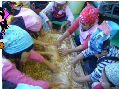
大豆と麹を混ぜ合わせます。