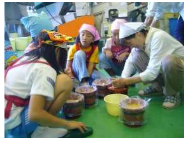
小さな樽に分けて、みんなで持ち帰りました。