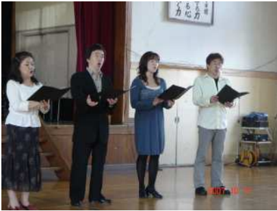
ソプラノ・アルト・テノール・バスの4名。

11月5日は、いよいよ文化庁事業「本物の舞台芸術コンサート」が開かれます。それに先だって、二期会の方が児童に合唱指導をしていただく「ワークショップ」が10月17日に行われました。たった4名のソリストでしたが、その歌声は体育館を揺るがすほどです。本番、28名がそろったら、どんな歌声になるのか鳥肌が立つほどでした。合唱指導でも、子ども達の歌声がみるみる変わっていくのが分かりました。中川大祭の音楽発表会とは、ひと味もふた味もちがった合唱をお聞きいただけだと思います。また、本番では中川小学校校歌を混声四部合唱に編曲して歌っていただけるそうです。どうぞ、お楽しみに！