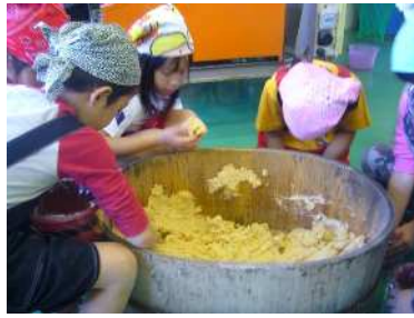
細かく砕いたものを樽の中へ。