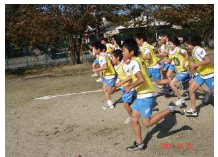
ほとんどの子が記録を伸ばしました。