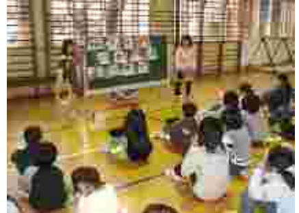
お店紹介。5年生は箱の中からオッパッピー！ 1年生はペットボトルボーリング。 2年生は写真屋さん。かぶり物がかわいい！