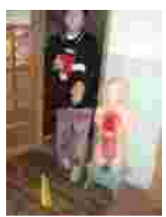
5年生は箱の中に手を入れて、何か当てます。きゃー！これなあに？ そして6年生は「お化け屋敷」おそろおそろ進むと、でたー！