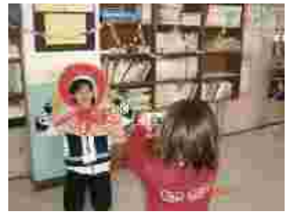
3年生は「1秒で見分けよう」何？ 4年生は「チャレンジランド」 1年生は教室にレーン。2年の写真屋「はい、ポーズ！」