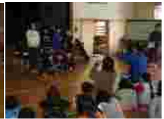
1年から6年まで、一緒にドッジボール。 投げるボールも協力。 優勝2班は、名誉の記念写真。