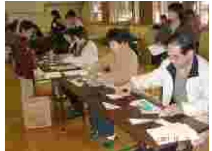
カーテンの間を飛ばす物を当てる3年生のお店。 4年生「わりばしポトン」大人も熱中。 「パズル」は手作りだからこそ難しい！