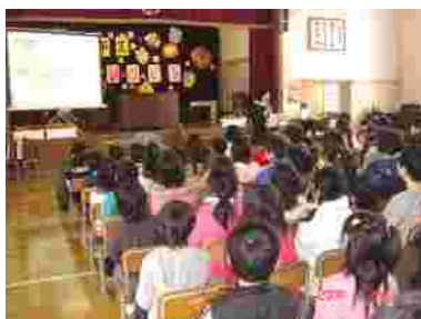
6年生のプレゼンテーション「中川小学校のあゆみ」

2月26日(火)は閉校式リハーサルを行いました。学級・学年で練習し、全校でそえるのは1回だけ。本番に強い子ども達。発表も歌声も素晴らしい内容でした。当日の感想など、お寄せいただければありがたいです。