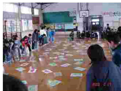
全校ゲーム「スイカとメロン」体育館にカードが