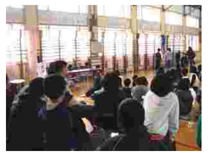
6年生からのお返しも心のこもった歌でした