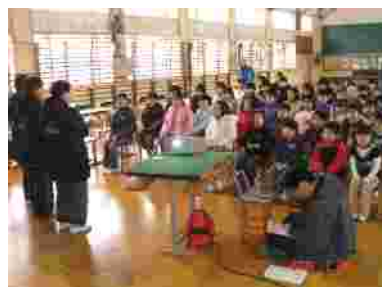
祖父母から聞いたエピソードを交えながら...。見つめる下学年。