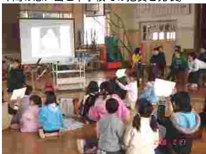
6年生クイズ 小さい頃の写真が写されるたびに笑いが。 参観の保護者も興味津々。