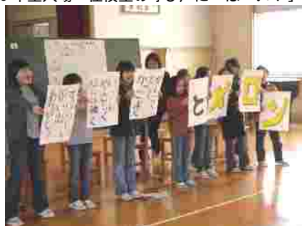
ゲームの題字の裏に4年生からのメッセージが。