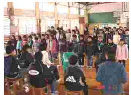
3年生の感謝の言葉は15本もの垂れ幕が!