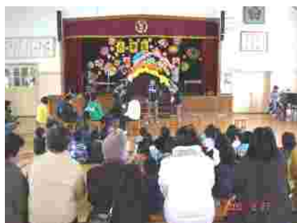
6年生入場 在校生の呼び声に「はーい!」6年間の思い出と中学校での抱負を発表。

2月27日(水)に、最後の6送会が行われました。各学年が工夫したイベントの数々。写真から、その感動の様子が伝わるでしょうか。