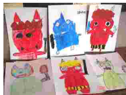
2年生が描いた追い出したい鬼

父親が逝って、20年目の命日がもうすぐです。きっと息子との豆まきを楽しみにしていたのだろうかあと、節分の時期になると思い出します。