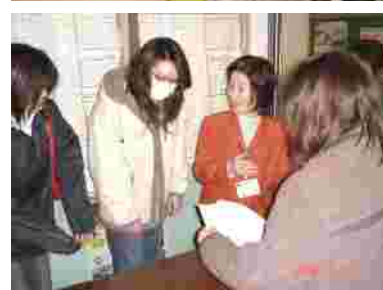
60名以上集まった最終準備