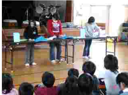
めずらしい折り紙の発表。発表後にプレゼント。