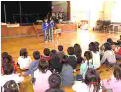
しっとりトリコーダーの発表。

子ども達の発表力発揮の場、「見て見て聞いて聞いてコーナー」最後の会は3組の発表でした。こんな発表が見られなくなるのが残念！