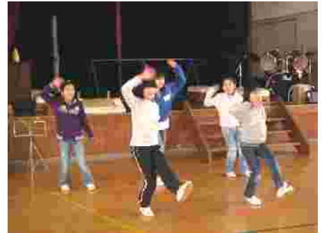
そして定番。ダンス！エグザイルでのりのり。