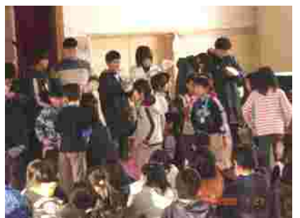
1・2年生からプレゼント 全校合唱「蕾」